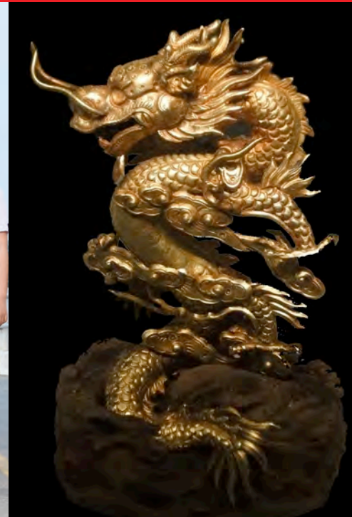
L'Envol du Dragon : art royal du Vietnam Musée national des arts asiatiques – Guimet