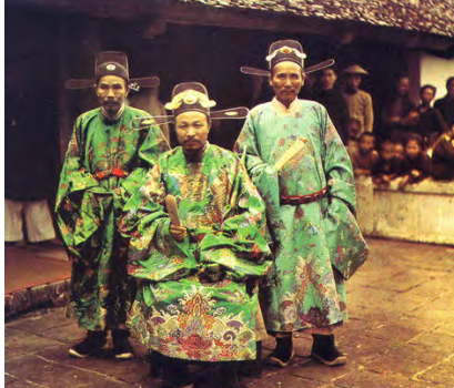
Autochrome de la collection Albert Kahn Cité internationale universitaire de Paris