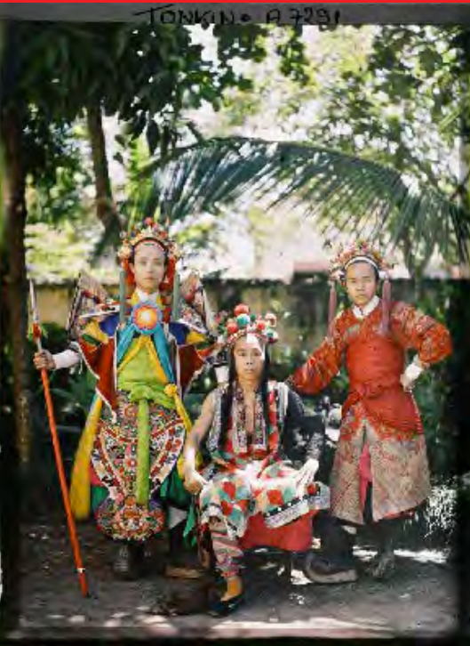
Autochrome de la collection Albert Kahn Cité internationale universitaire de Paris