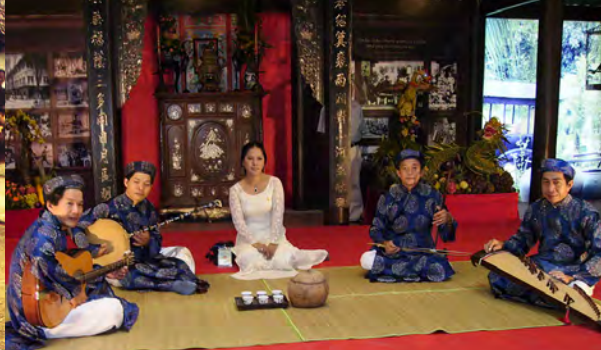
LE ĐÓN CA TÀI TU Musique du delta du Mékong : ensemble Quê M